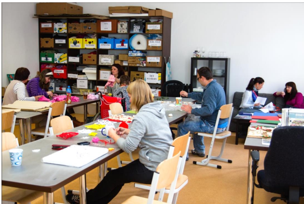
Tvořivá dílna Mezi námi

tvořivé dílny se podíleli významní sponzoři – firmy SEA, Remis, Revipro a Salve a drobnými dary a materiálem přispělo mnoho dárců z řad veřejnosti.